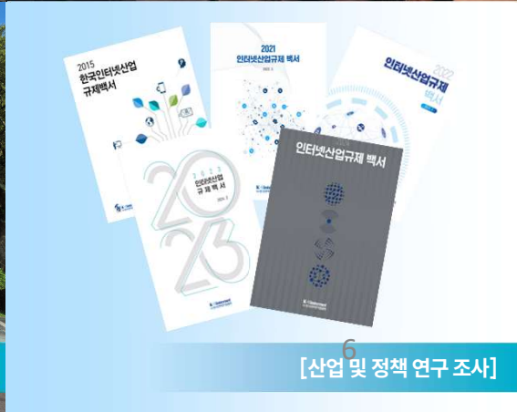
[산업 및 정책 연구 조사]