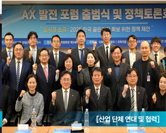
[산업 단체 연대 및 협력]