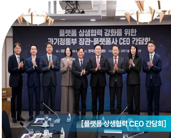
[플랫폼 상생협력 CEO 간담회]